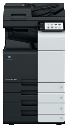
bizhub i-Series C360i