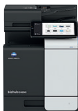
bizhub i-Series C4050i

По мере роста вашего бизнеса, мы будем расти вместе с вами — органично объединяя людей и пространство, создавая новое окружение с защищенными бизнес-процессами и документооборотом.